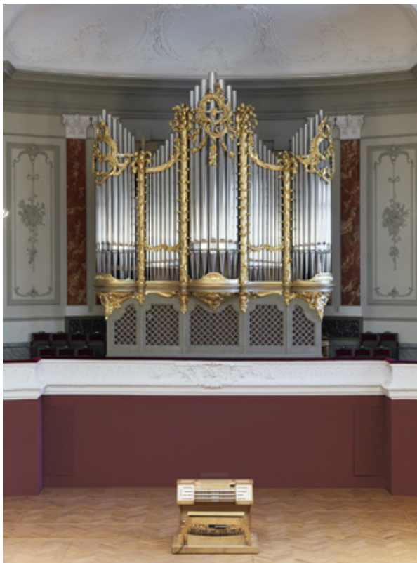
Musiksaal Stadtcasino 2020