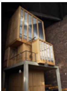
St. Anna D - Düren 2010 III/P/48