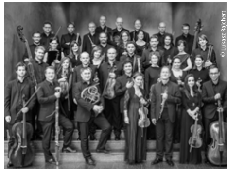
ENSEMBLE DES KAMMERORCHESTER BASEL

Das Orchester setzt sich auch für zeitgenössische Musik ein. Jährliche Kompositionsaufträge und die Mitwirkung bei Basel Composition Competition belegen dieses Engagement. Ein Herzstück ist zudem die zukunftsweisende Vermittlungsarbeit mit Kindern und Jugendlichen.