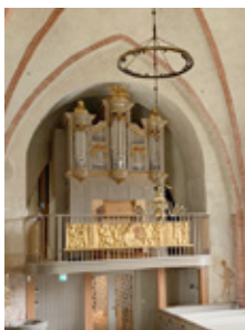
S - Sollentuna II/P/26 2021