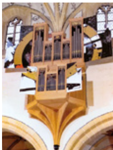
Stadtkirche CH - Biel 1994 II/P/9